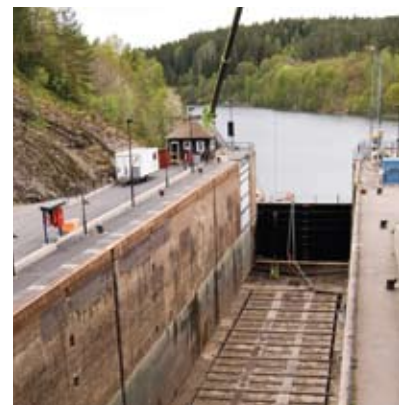
Nedre slussarna i Trollhättan, två Matadorpumpar håller undan läckvatten innanför en temporär slussport.

om att hyra Grindex pumpar. Då den planerade tiden för pumpningen var knapp ville man försäkra sig om att allt verkligen fungerade som det skulle. Personal från Grindex tekniska support hjälpte till med beräkningen av operationen, man utgick från en tömningstid mellan 9 och 16 timmar. Till detta rekommenderade Grindex pumpar av modellerna Matador och Maxi till uppdraget som har ett flöde på 306 respektive 684 m 3 /timme vid 6 meters tryckhöjd. Totalt hyrdes 17 pumpar, varav några som backup.