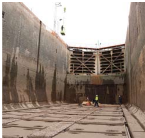
Varje slusskammare är 90 meter lång, 13-18 m djup och 13 m bred.